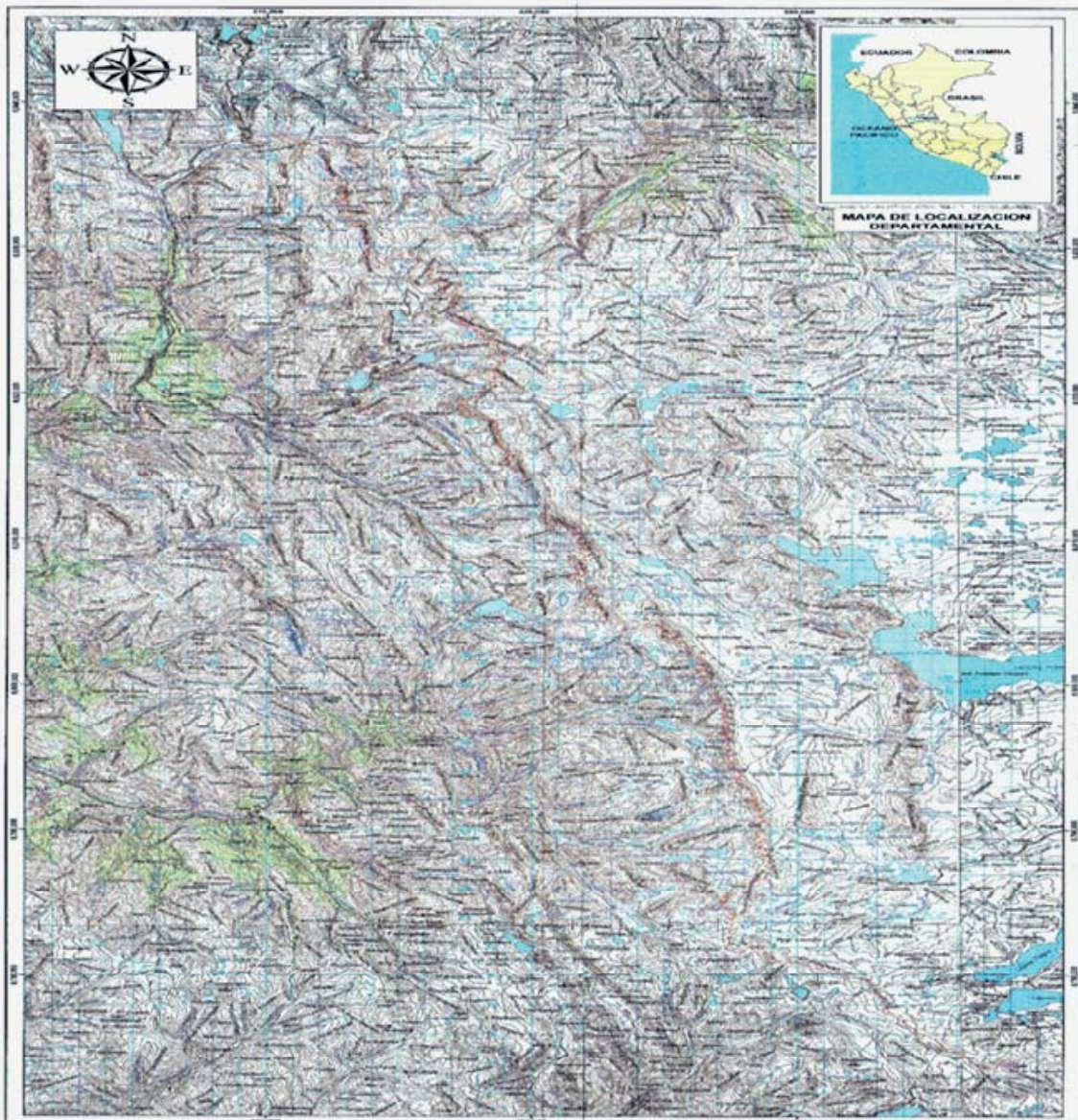
Limite Territorial entre los departamentos de Pasco y Lima